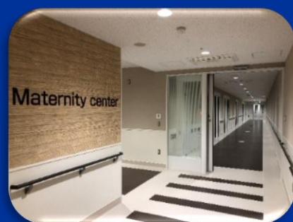
11月にリニューアル 産婦人科病棟

お問合せ 静岡県立総合病院 総務課 TEL 054-247-6111 / MAIL gh-keiei@i.shizuoka-pho.jp