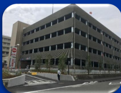
9月に完成 北立体駐車場