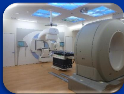
4月に導入 高精度放射線装置