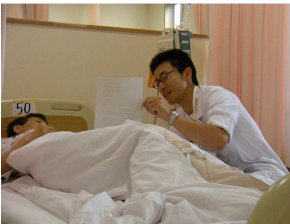
外来化学療法センターでの患者指導