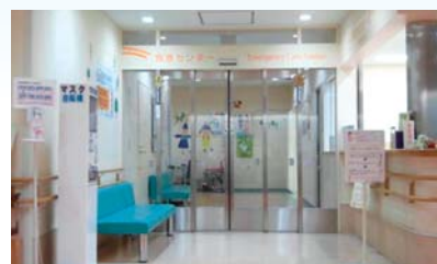
救急センター入口

小児救急センターは昨年6月開設以来、1年間の受診者数は5,493名(1日平均15名)、紹介患者数は427名(全受診者の8%)、そのうち当院かかりつけ患者数は2,296名(全受診者の42%)、入院患者数は1,173名(全受診者の21%)、ICU入室患者数は67名、受診者全体に占める外因性の割合は8%でした。救急車による受診者数は599名(全受診者の11%)、Dr.ヘリによる受診者は10名です。受診患者のトリアージの内訳は、それぞれカテゴリー1:1%、カテゴリー2:7%、カテゴリー3:52%、カテゴリー4:25%、カテゴリー5:15%でした。