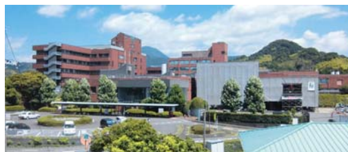
病院の正面。グレーのシートで覆われた部分が新外来棟

現在、壁や天井部分のコンクリート打ちを行っており、工事の進捗は順調そのものです。これから台風シーズンを迎えますので、施工業者とともに、工事へ大きな影響が及ばないことを天に祈る毎日です。