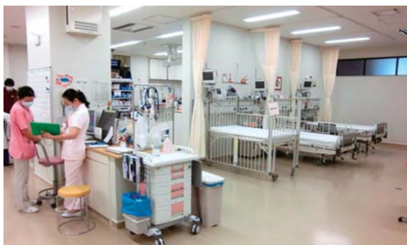
センター内部。最新鋭の医療機器と精鋭スタッフを配置。

開設1年目は、笑気やシヨ糖を使用した積極的な鎮痛を行なうこと、虐待の早期発見を目指したリスト作り、週1回のシミュレーショントレーニング、ネブライザーと加圧式定量噴霧式吸入器の有効性の比較、交代勤務と当直制の併用による医師の負担軽減などに取り組んできました。父兄や養護教諭などに予防の重要性に関する講義や小児応急処置の実習などを行なった「こども救急クラブ」も毎回30名以上の参加者を集めて3回実施いたしました。2年目の目標として、外因性疾患のより積極的な受入れとEMLAクリームの有効性に関する研究、地域の医療機関との連携を深め紹介患者数を増やすことなどを掲げております。