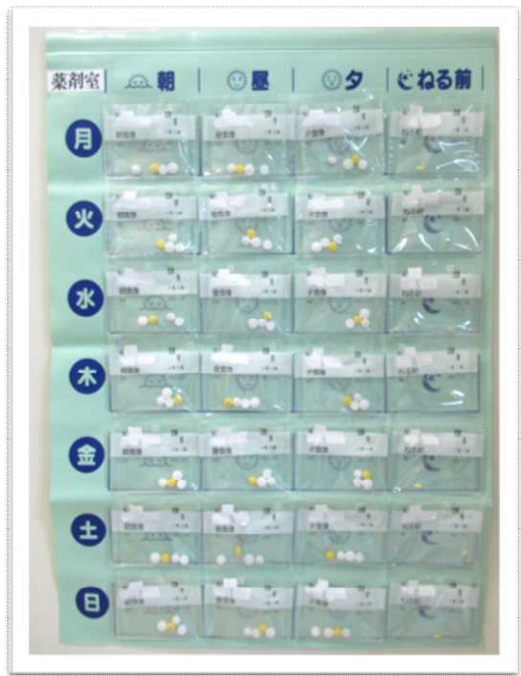
お薬用のカレンダー