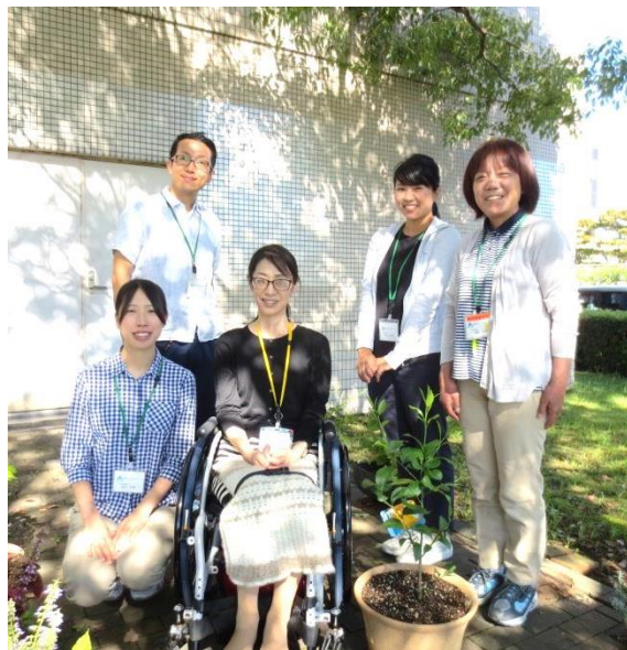
デイケアセンター

今後も利用者さんのよりよい生活のために丁寧で細やかな支援ができるようスタッフ一同努力していきたいと思えます。