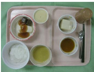
嚥下障害プリン食