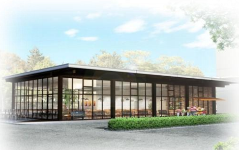
アメニティ棟完成予想図（平成24年3月完成予定）

静岡県立総合病院では、来院される患者さまや、お見舞いのご家族の皆様の利便性向上を図るため、食堂などが入る「アメニティ棟」や、コンビニを建設しています。来年度、これまで地下にあった食堂・売店が、新しく生まれ変わります。アメニティ棟建設地は正面玄関バス停の裏側です。工事中は皆様にご迷惑をおかけいたしますが、ご理解いただけますようお願い申し上げます。