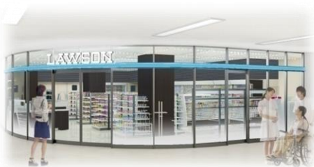
コンビニ完成予想図（平成24年5月完成予定）