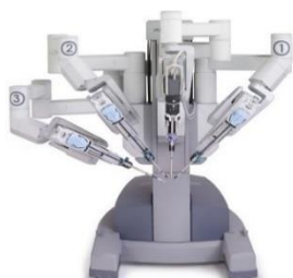
ダヴィンチシステム