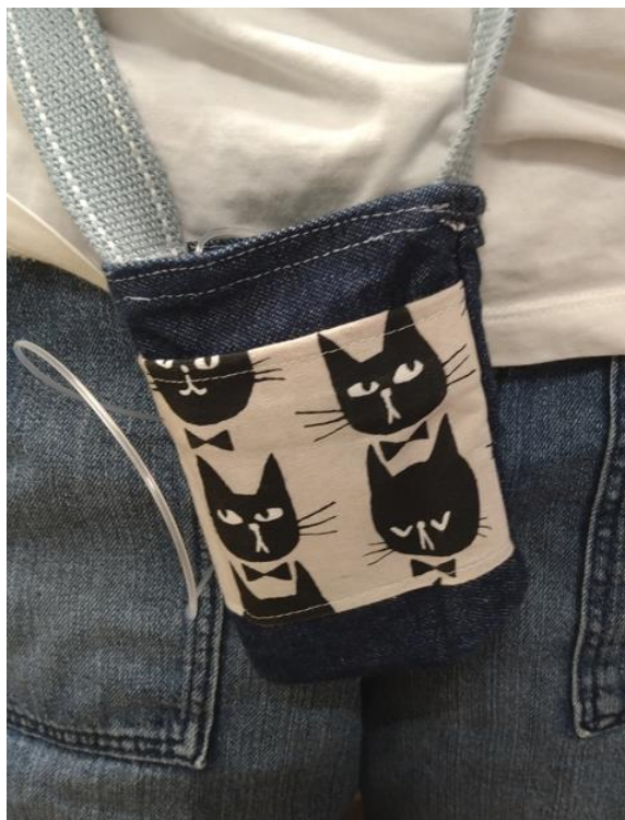
小学生の女兒 母の手作り