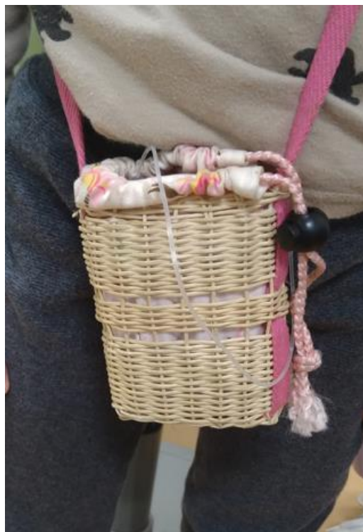
年長の女兒 おばあちゃんの手作り