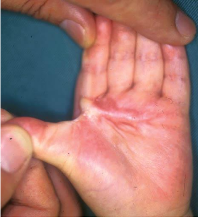
手のひらのやけど