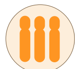
ダウン症候群 (21トリソミー)