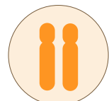
一般的な21番染色体