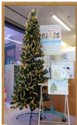
ゴールドリボンツリー