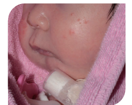
ロバンシークエンス