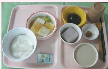
嚥下障害食の一例