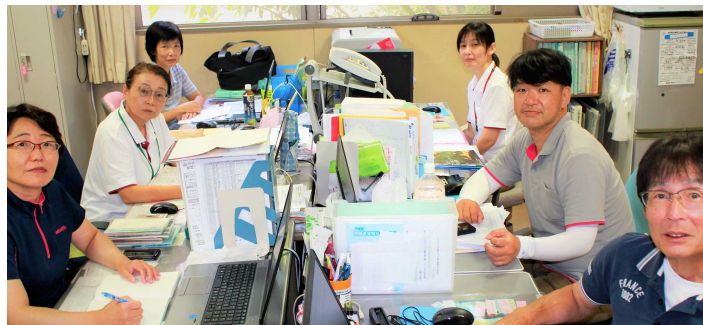
新型コロナウイルス感染対策のお知らせとお願い

「まずは安心して家で暮らせるようになりたい」「少しでも自立を目指したい」という気持ちに寄り添いながら、実現できるように支援していきたいと考えています。