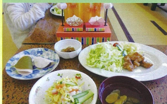
クッキング:自分たちの昼食を作っています

*就労を目指す方も多く在籍していることもあり、就労支援に加えて市内の就労移行支援事業所を招いて就労に関するセミナーも随時開催しています。