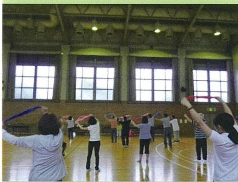
3B体操:楽しく身体を動かしています