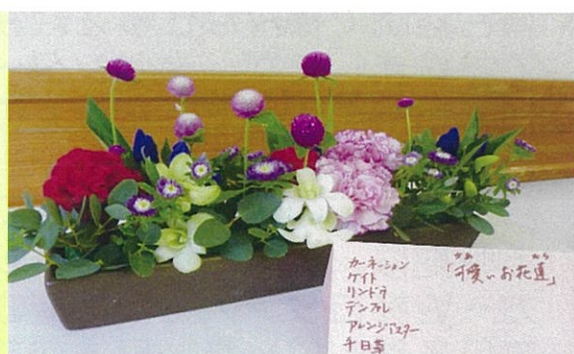
フラワーアレンジメント:院内に飾っています