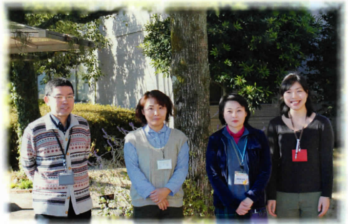
リハビリテーションスタッフ

今後もみなさまがデイケアを身近に感じ活用していただけるように努力していきたいと思います。デイケアに関心をもたれた方は、主治医に相談してみてください。