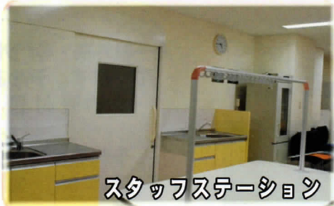
スタッフステーション