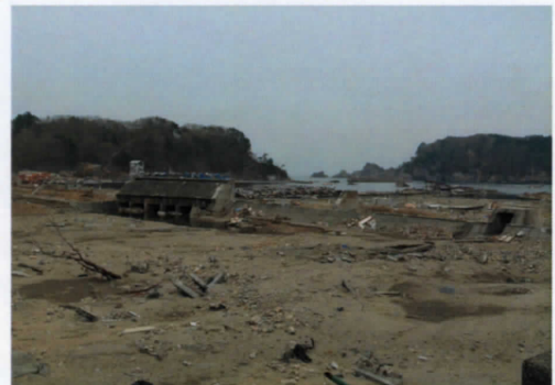
<世界に誇ったスーパー堤防の惨状> (宮古市田老地区)

今後ますます、こころのケアのニーズが高まってゆくとわれ、今後も同地区に支援を続けてまいります。