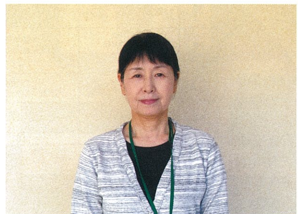
よろず相談センター

患者さんに対する「退院支援委員会」開催の調整をします。当センターでは精神保健福祉士がその役割を担っています。「様々な制度や福祉のサービスの利用に関すること」・「入院中から退院後の生活上の様々な相談にのり、支援してくれる相談支援事業所などの紹介や連絡調整を行い円滑な地域生活への移行を図ること」など、患者さんの早期退院に向けた活動をしています。入院時、担当相談員をご案内していますので、ご相談いただければと思います。