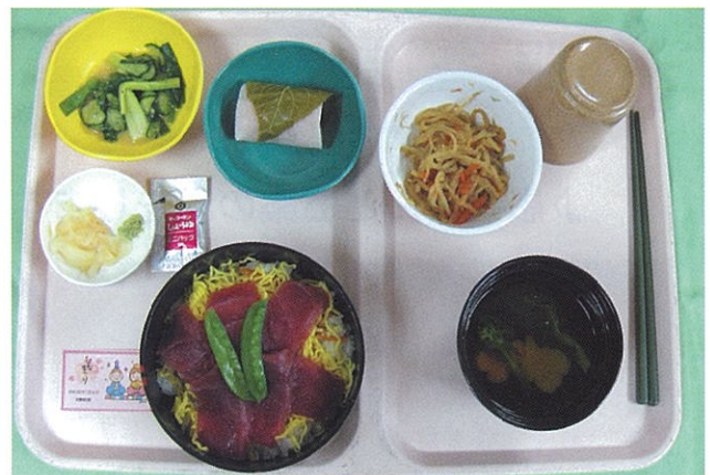
行事食 ひなまつり