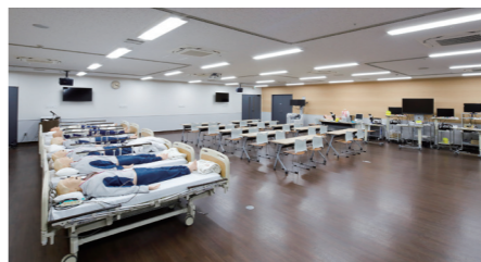
メディカルスキルアップセンター