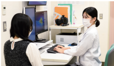
口腔外科手術の様子(左上) 外来診療の様子(上) 歯科口腔外科スタッフ(左)